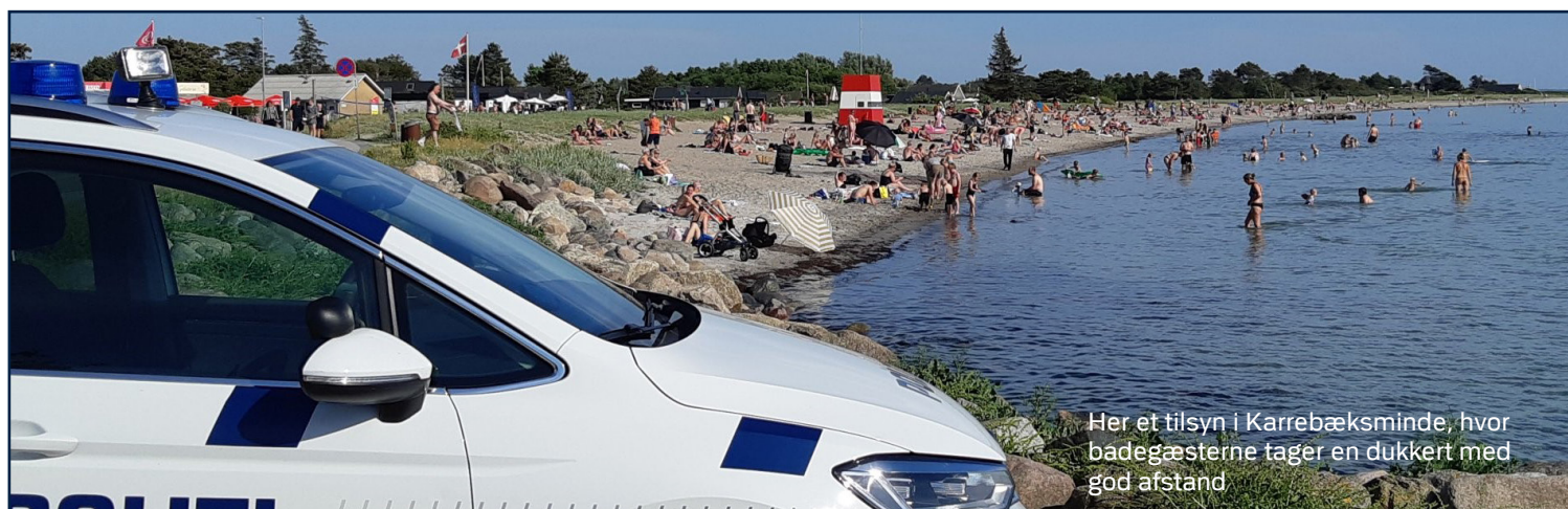
Her et tilsyn i Karrebæksminde, hvor badegæsterne tager en dukkert med god afstand

NYHEDSBREV OM SAMARBEJDET MELLEM DIT LOKALRÅD OG SYDSJÆLLANDS OG LOLLAND-FALSTERS POLITI